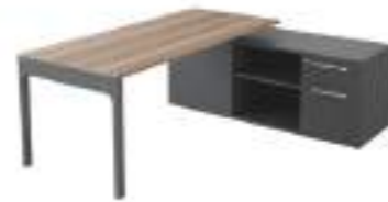
Ref: LC662A H: 720 W: 1815 D: 1600