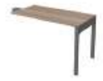
Ref: LC613 H: 720 W: 1200 D: 600