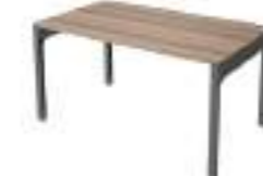
Ref: LC602 H: 720 W: 1600 D: 800