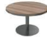
Ref: LC517 H: 720 W: 1200 D: 1200