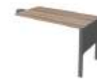
Ref: LC513 H: 720 W: 1200 D: 600