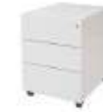
Ref: BL01923 H: 560 W: 420 D: 540