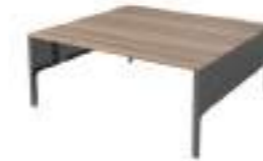
Ref: LC582 H: 720 W: 1600 D: 1630