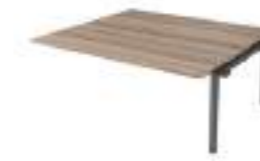
Ref: CQNX572 H: 720 W: 1600 D: 1630