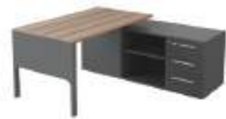
Ref: LC562J H: 720 W: 1815 D: 1600