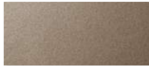
BRONZE (ONLY PIEM)