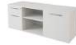
Ref: BL02125A H: 600 W: 1600 D: 565