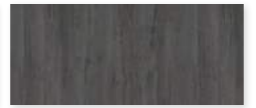
BLACK AMBER OAK