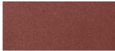
OXIDE (ONLY PIEM)