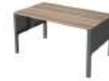
Ref: LC502 H: 720 W: 1600 D: 800