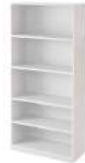
Ref: BLA233 H: 2055 W: 930 D: 400