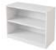
Ref: BLA231 H: 745 W: 930 D: 400