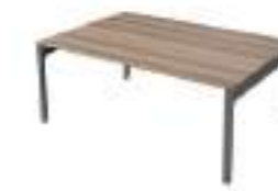
Ref: LC668 H: 720 W: 1600 D: 1200