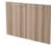
Ref: SN02135C H: 670 W: 920 D: 20