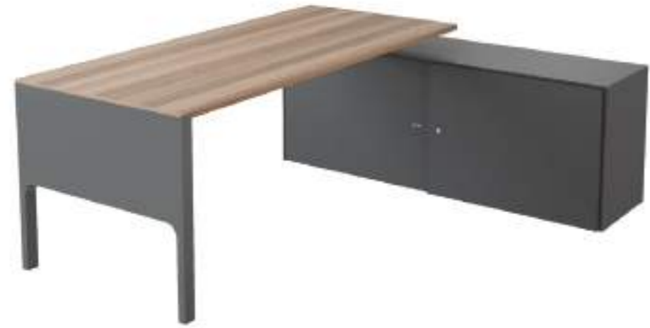
Ref: LC552 H: 720 W: 1815 D: 1600