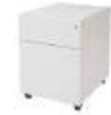
Ref: BL01924 H: 560 W: 420 D: 540