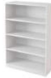
Ref: BLA232 H: 1385 W: 930 D: 400