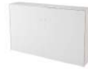
Ref: BLAM22 H: 1230 W: 2000 D: 400