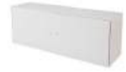
Ref: BLAM21 H: 600 W: 1600 D: 460