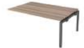
Ref: CQNX578 H: 720 W: 1600 D: 1200