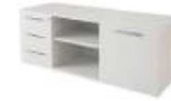
Ref: BL02125J H: 600 W: 1600 D: 565