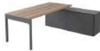
Ref: LC652 H: 720 W: 1815 D: 1600